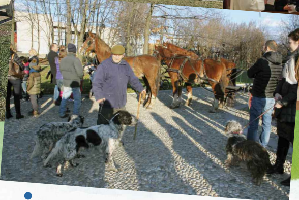
Festa di S. Antonio Abate: benedizione degli animali, delle auto e delle moto.