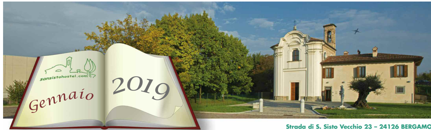
Strada di S. Sisto Vecchio 23 - 24126 BERGAMO www.sansistohostel.com Tel./Fax +39 (0) 35 321599 E-mail: info@sansistohostel.com

Caro diario, eccomi di nuovo, per cercare di raccontarti un po' di quanto succede qui; anche noi abbiamo potuto godere dell'atmosfera incantata delle feste natalizie, con gli addobbi colorati sparsi qua e là, l'albero (vedessi che albero, alto tre metri, pieno di palline e di luci intermittenti), il presepe, che ci ricorda ancora una volta la nascita del Bambinello Gesù.