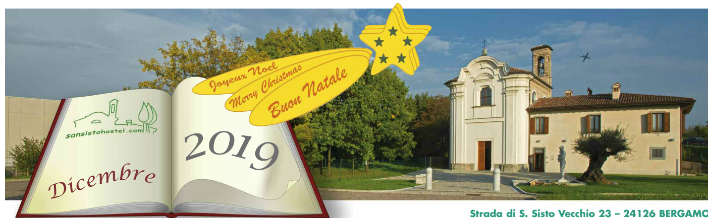
Strada di S. Sisto Vecchio 23 - 24126 BERGAMO www.sansistohostel.com Tel./Fax +39 (0) 35 321599 E-mail: info@sansistohostel.com